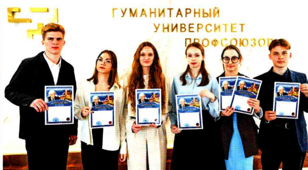
Старшеклассники — участники форума