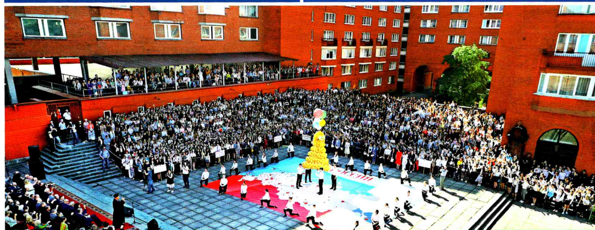
Площадь академика Лихачева, День знаний в Санкт-Петербургском Гуманитарном университете профсоюзов